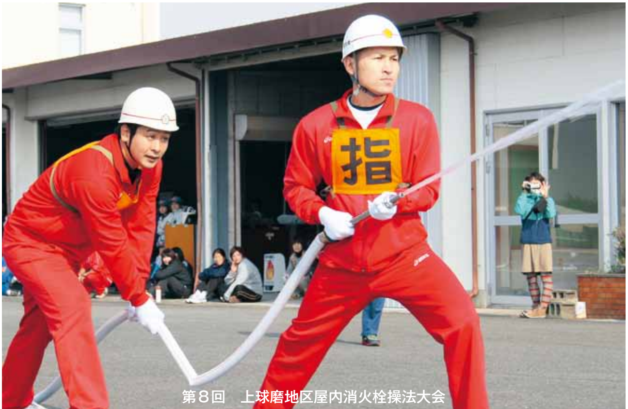
第8回 上球磨地区屋内消火栓操法大会