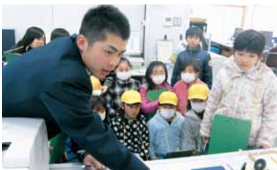
深田小学校 3年生社会科見学