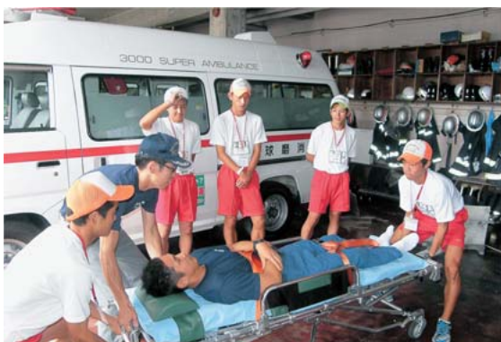
救急処置訓練を行う高校生